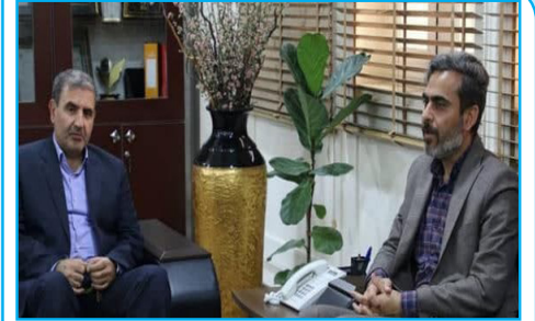
تعامل حاکمیت نهادهای اساسی جامعه رکن اصلی تحول انقلابی در فرهنگ عمومی

سال ششم - شماره ۱۰۹ - پنجشنبه ۳۱ فروردین ماه ۱۴۰۲ - ۲۹ رمضان ۱۴۴۴ - ۲۰ آوریل ۲۰۲۳ - قیمت ۵۰۰۰ تومان