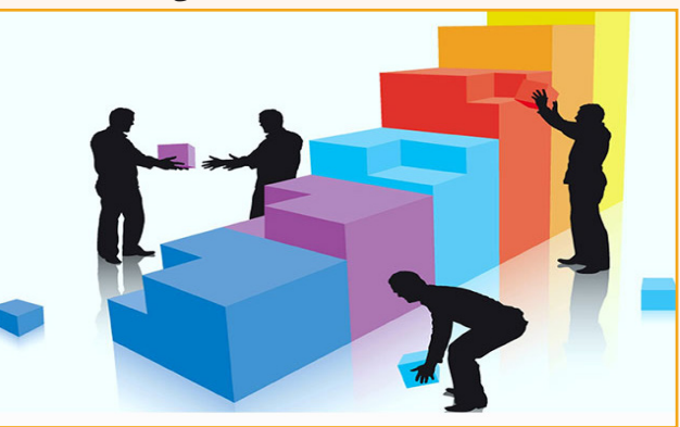
ششم - شماره ۱۰۹ - پخشیه ۳۱ فروردین ۱۴۰۲ - ۲۹ رمضان ۱۴۴۴ - ۲۰ آوریل ۲۰۲۳ - قیمت ۵۰۰ تومان

این روزها داستان قیمت گذاری خودرو و واردات خودرو و ... داغ داغ است. اما آخرین اقدامات صورت گرفته در دستگاههای اجرایی و همچنین طرح مشکلات پیش رو، برنامه های لازم جهت تسریع در انجام امور و رفع موانع را انجام داد و در این راستا از ظرفیت سایر دستگاهها استفاده کرد. مدیرکل راه و شهرسازی تاکید کرد: افزایش و بهبود کیفیت زندگی اساسی ترین موضوعی است که ما در وزارت راه و شهرسازی پیگیر تحقق آن هستیم. در ادامه این نشست نمایندگان دستگاه های عضو شورا گزارش مختصری از عملکرد دستگاههای خود را خدمت حاضرین در جلسه ارائه نمودند. لازم به توضیح است شورای هماهنگی با حضور مدیرکل راه و شهرسازی و مدیران کل راهداری و حمل و نقل و جاده های، هواشناسی، آزمایشگاه فنی و مکانیک خاک، بانک مسکن، بنیاد مسکن انقلاب اسلامی، بنادر و دریاوردی، فرودگاه، هواپیمایی (هما) پلیس راهور، فرماندهی پلیس راههای استان در این اداره کل برگزار شد. مقرر گردید جلسات شورای هماهنگی امور راه و شهرسازی استان به صورت مستمر برگزار شود.