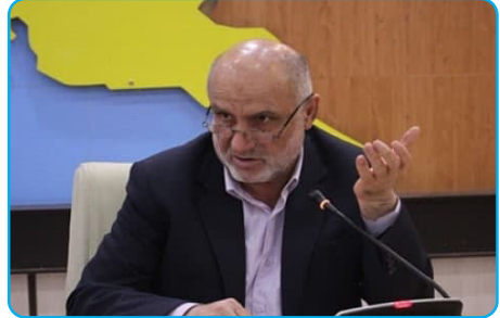
استاندار بوشهر خواستار جایجایی ساکنان هلیله و بندرگاه شد