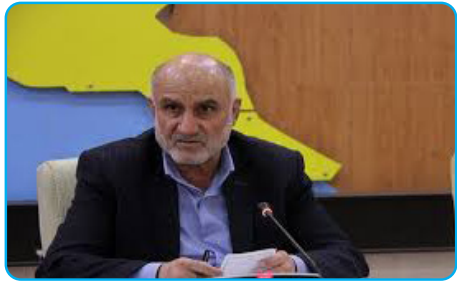
انتخابات استان بوشهر در سلامت و امنیت کامل برگزار شد