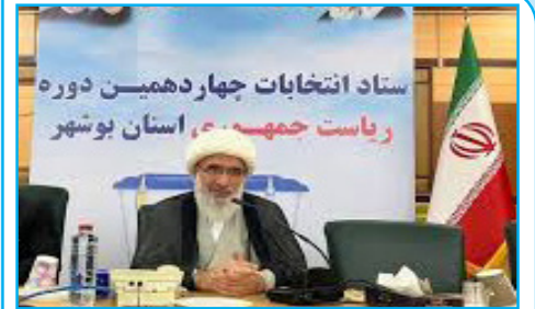
مردم ایران پیروز انتخابات بودند

روزنامه‌نگاری یعنی انتشار خبری که نمی‌خواهند منتشر شود، باقی کارها کار روابط عمومی است. ( جرج اورول ) سال هفتم - شماره ۱۴۷ - شنبه ۱۰ تیر ماه ۱۴۰۳ - ۲۳ ذوالحجه ۱۴۴۵ - ۳۰ زون ۲۰۲۴ - قیمت ۵۰۰۰ تومان